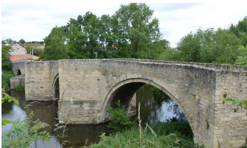
Pont médiéval de Saint-Généroux

Cela se traduira par encore plus de visites, d'animations et de découvertes au cœur du Thouarsais, pour tous les publics.