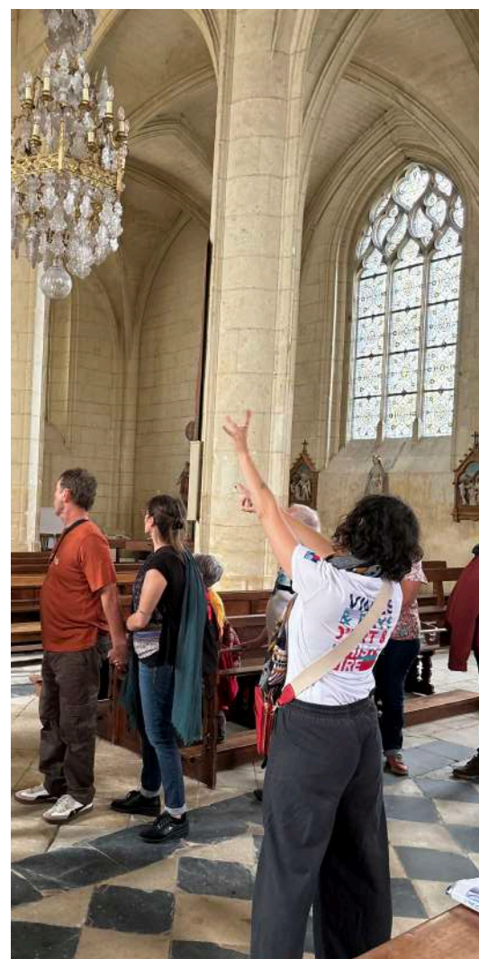
Visite de la chapelle du château durant les JEP