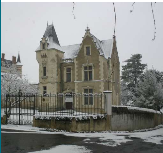
Le musée Henri Barré sous la neige