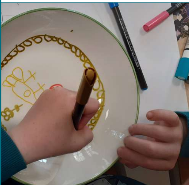
Atelier faïence à l'école des patrimoines