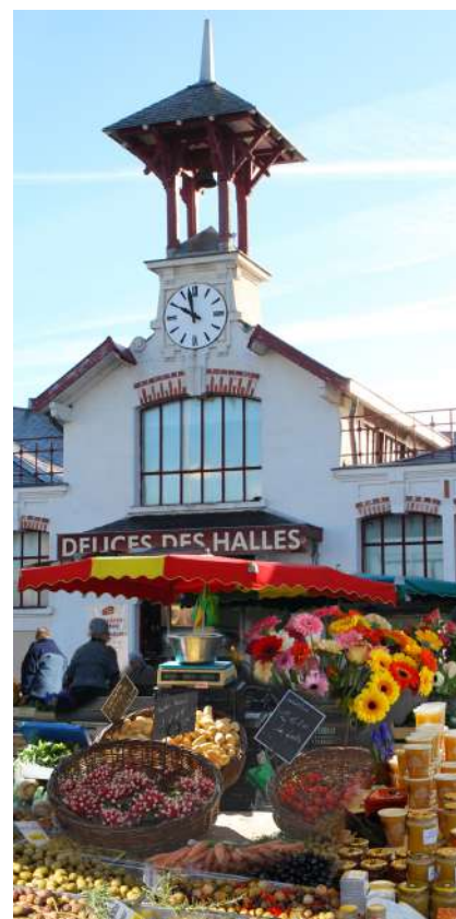
Jour de marché sur la place Lavault