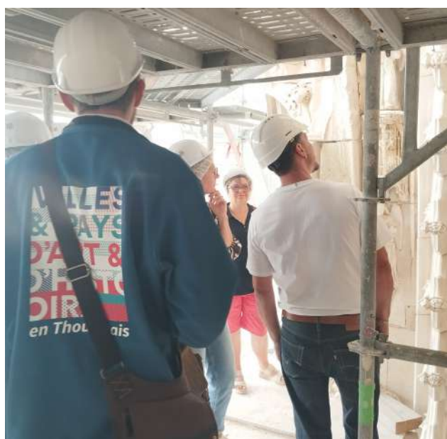
visite chantier de la chapelle du château