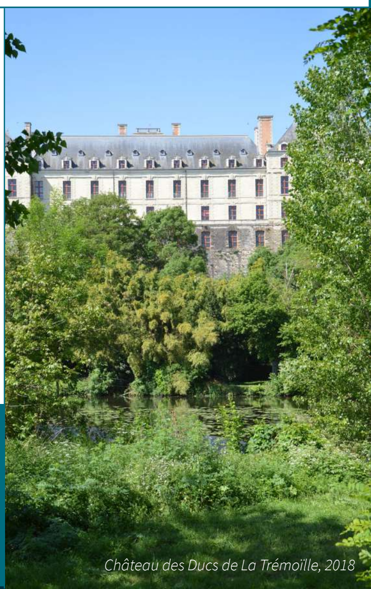
Château des Ducs de La Trémoille, 2018

Cette lettre d'information, évoluera au fil des numéros. N'hésitez pas à la partager autour de vous et à nous faire part de vos retours et suggestions pour l'enrichir et mieux répondre à vos attentes.